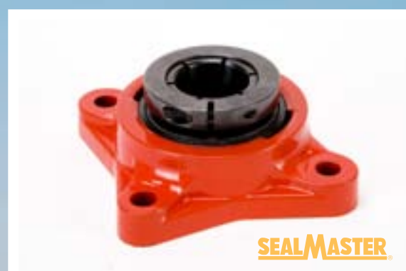
Lager bärrullar: Trimax nya Tri-Bolt™ lagerhus med Sealmaster® SKWEZLOC® lager för ultralång livslängd.