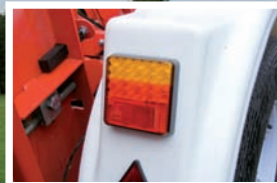
Fler-volts system LED belysning.