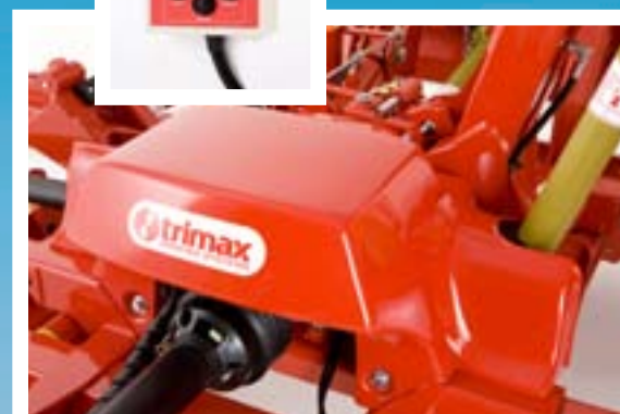
Plastgjutet skydd för elektrohydrauliska komponenter (Elite modellerna)