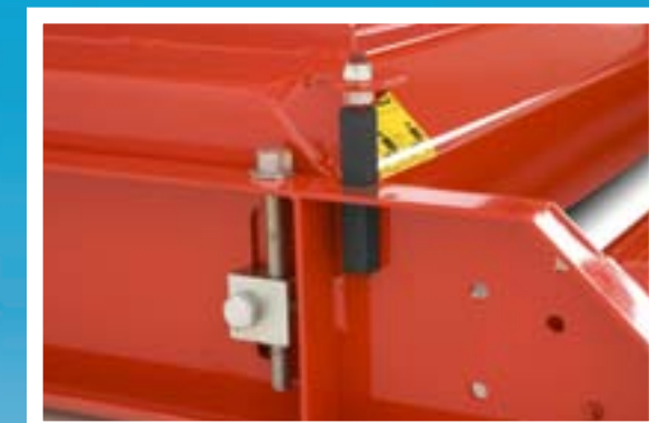
Markeringar för en enkel och exakt justering av klipphöjden.

Tillverkaren har en policy till vidareutveckling av sina produkter – förbättringar och förändringar kan därför ske utan vidare meddelande. DESIGNED & MANUFACTURED IN NEW ZEALAND