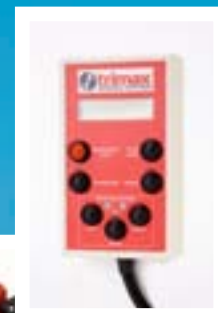
Ny förbättrad kontrollbox (Elite modellerna)