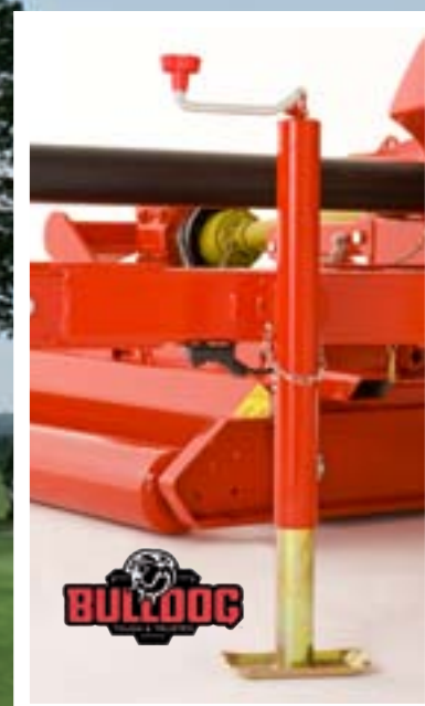
Stödben "Bulldog" av hög kvalitet.