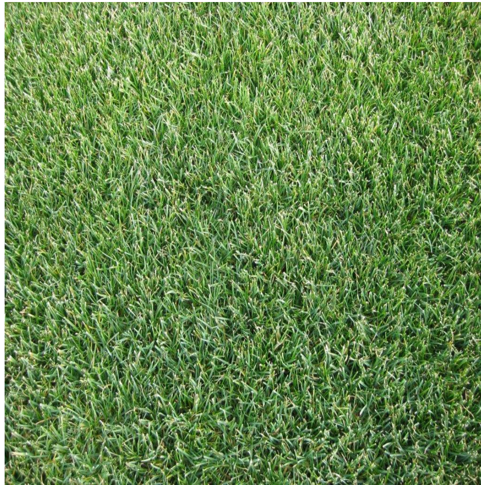
Spelbart, inget konstgräs syns