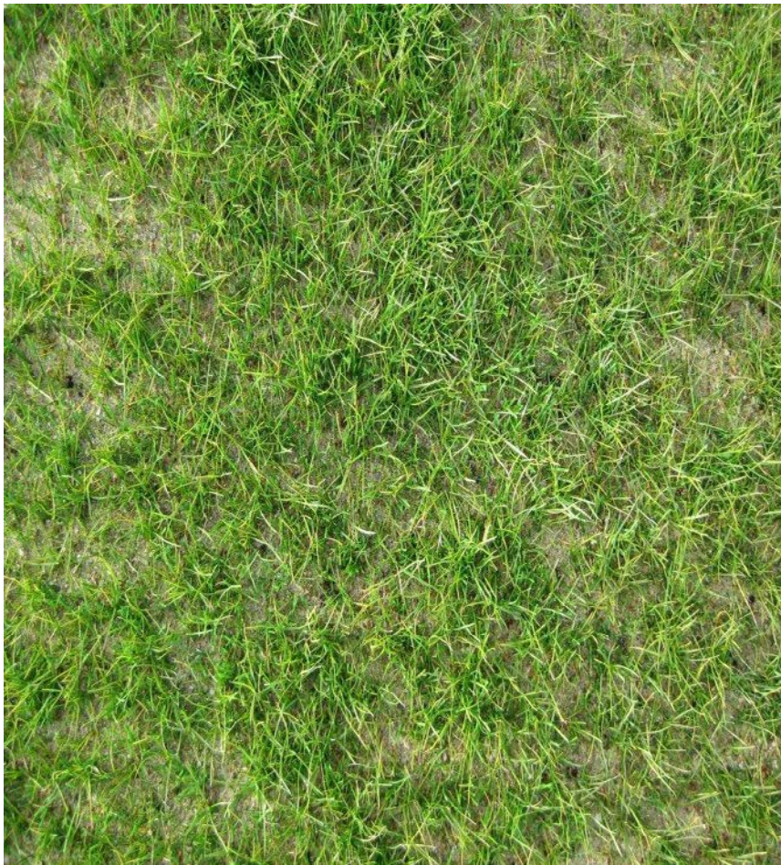
Nysådd yta, svårt att upptäcka konstgräs